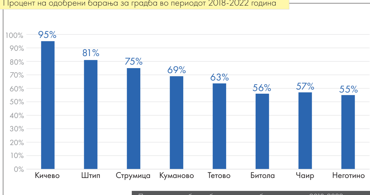
Процент на одобрени барања за градба во периодот 2018-2022 година

Во петгодишниот период од 2018 – 2022 година, општините просечно одобрувале 69 % од добиените барања за градба. Притоа, на врвот со одобрени дури 95 % од барањата е Кичево, а на дното Неготино, каде што се одобрени 55 % од добиените барања за градба.